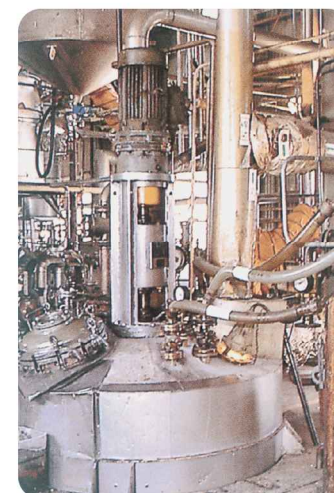
合成樹脂反応装置